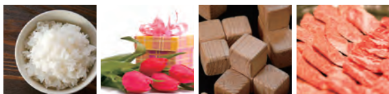
※画像はいずれもイメージ