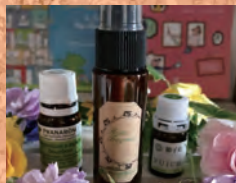
メンタルバランス美容液作り ③