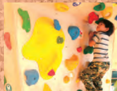
はじめてのクライミング ⑥