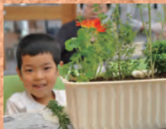
キッチンハーブのミニプランター ②