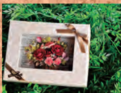
レカンフラワー講座 ①