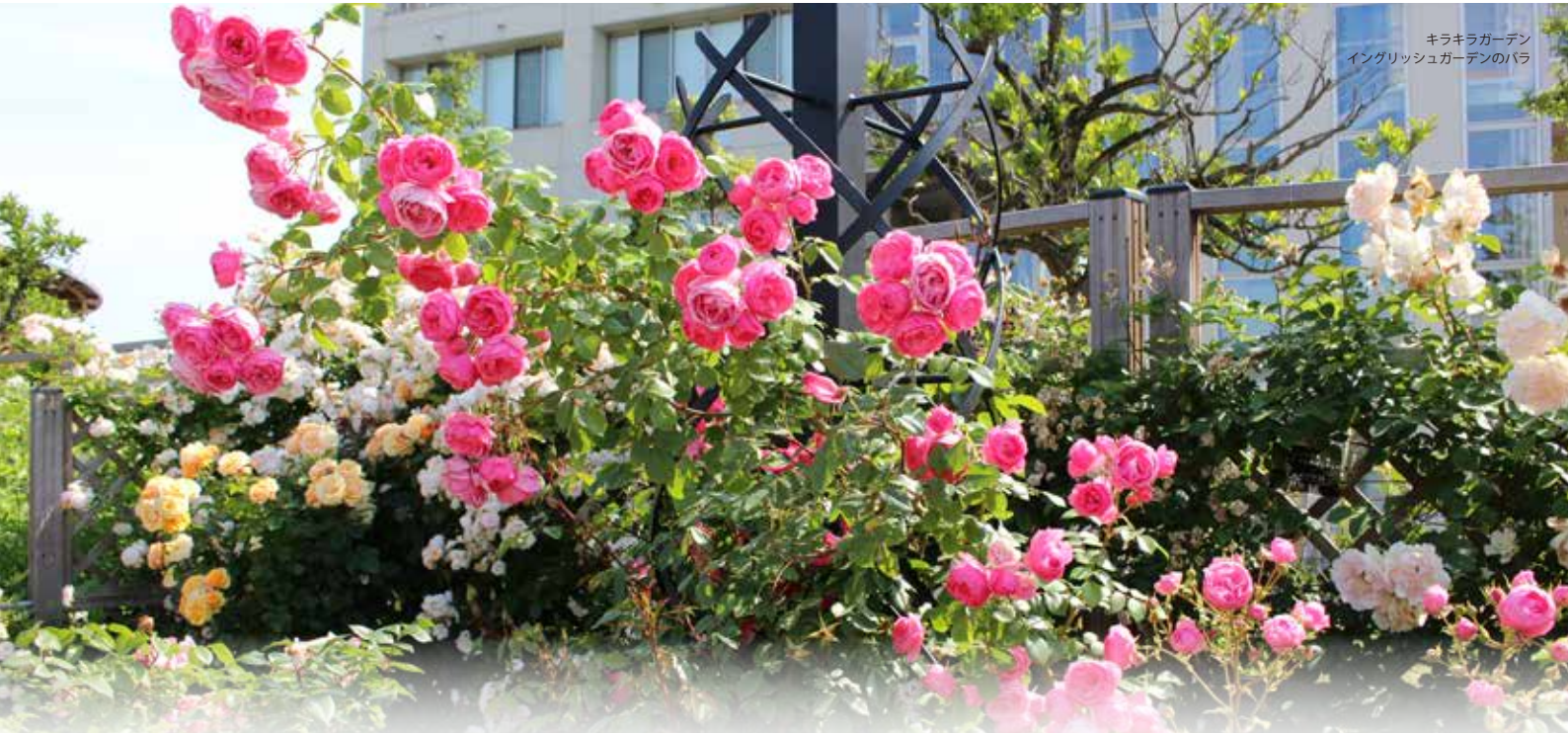
キラキラガーデン イングリッシュガーデンのバラ