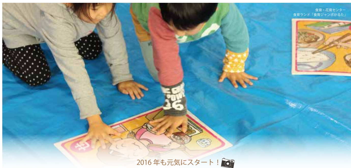
2016年も元気にスタート!